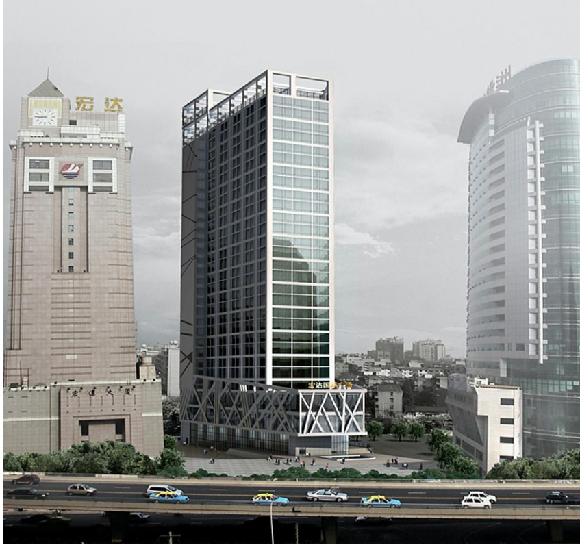
公司成都办公大楼图