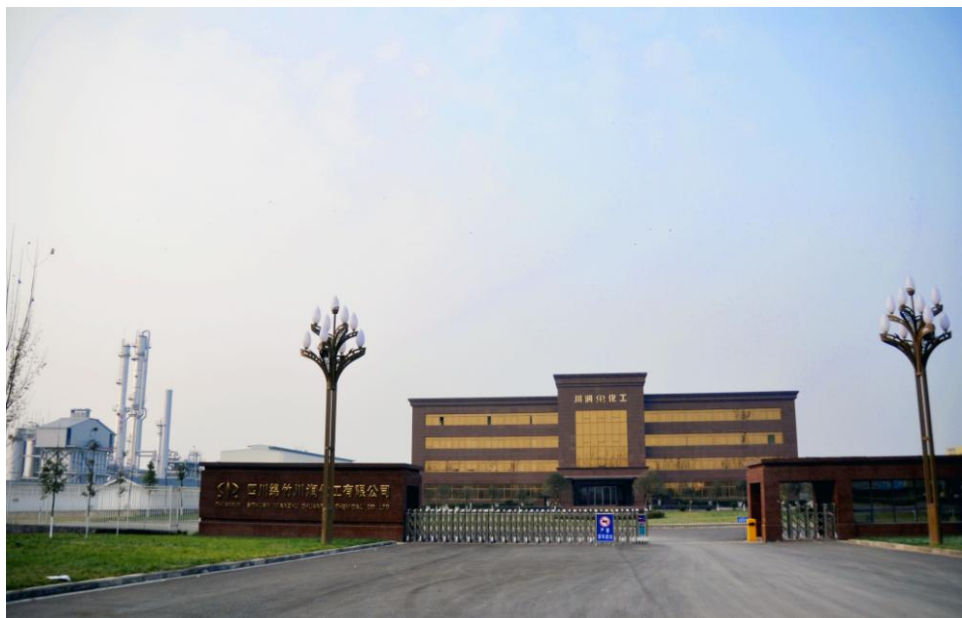
四川绵竹川润化工有限公司厂区图