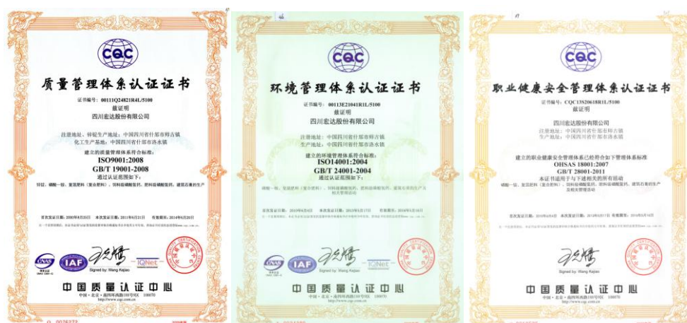
ISO14001/ OHSAS18001/ ISO9001 证书